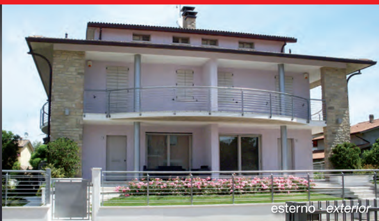
esterno · exterior