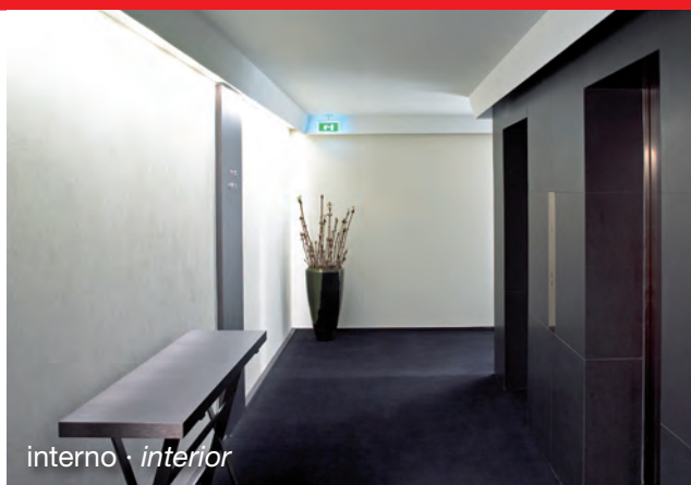
interno · interior