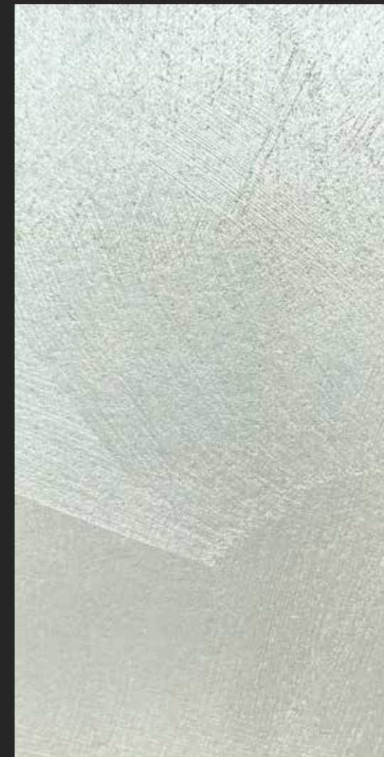
CREATIVE ARD SAND - sabbia