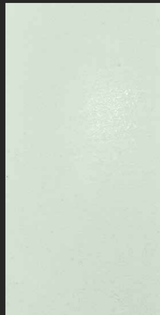
CREATIVE ARD LIME CARRARA