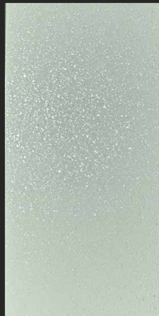
CREATIVE FONDO + ARCHISTAR