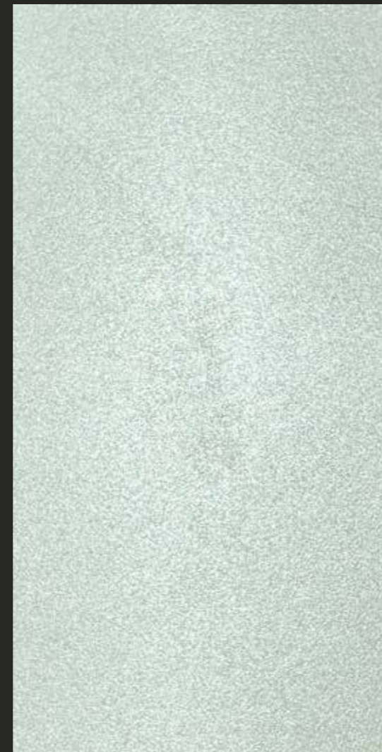
CREATIVE SHINY DESIGN - spatolato