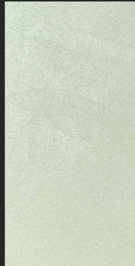
CREATIVE SETARD - spatolato