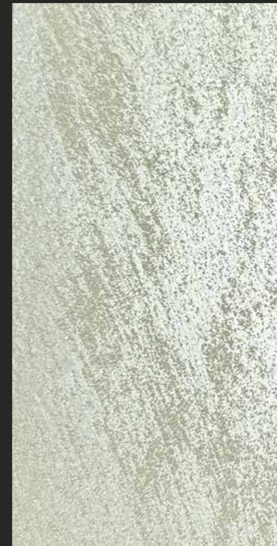
CREATIVE DESERT STONE - sabbia