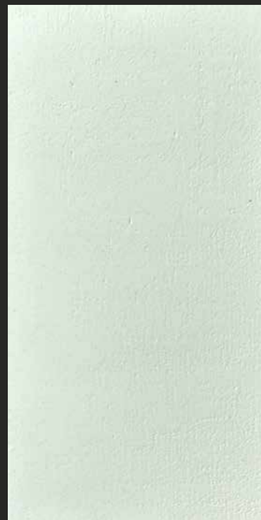
CREATIVE ARD LIME RASATO - marmorino