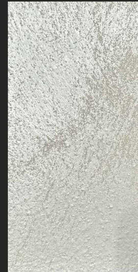
CREATIVE DESERT STONE + ARCHISTAR