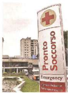
OSPEDALE Il Pronto soccorso

► In aumento le aggressioni fisiche e verbali contro medici ► Il bilancio del 2025, nell'organico mancano 80 infermieri: e operatori in ospedale, distribuiti 100 kit per dare l'allarme carenza dimezzata e l'Azienda punta a nuove assunzioni