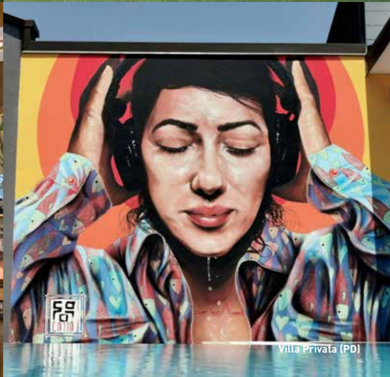
Villa Privata (PD)