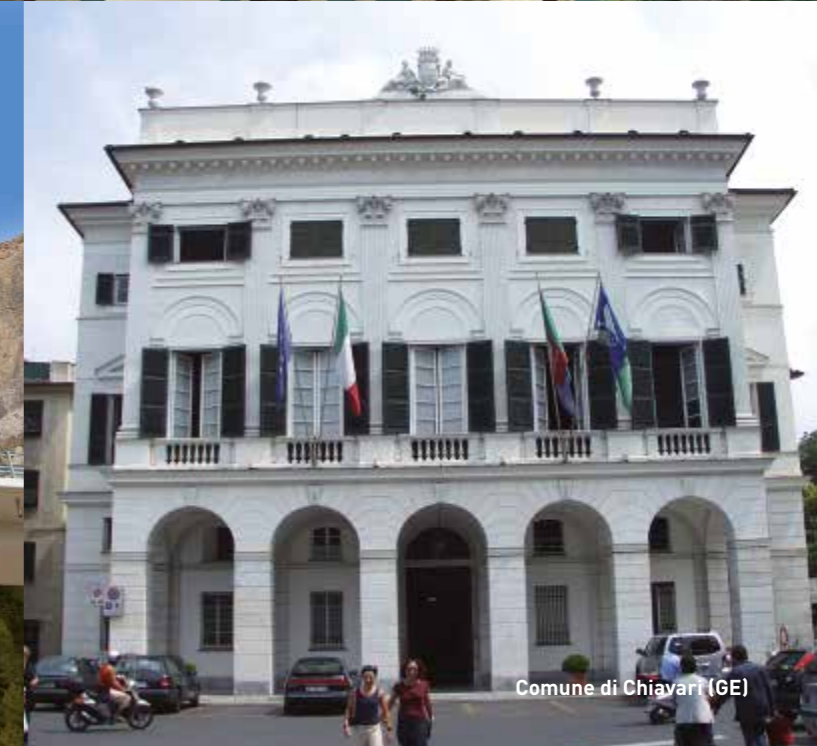
Comune di Chiavari (GE)