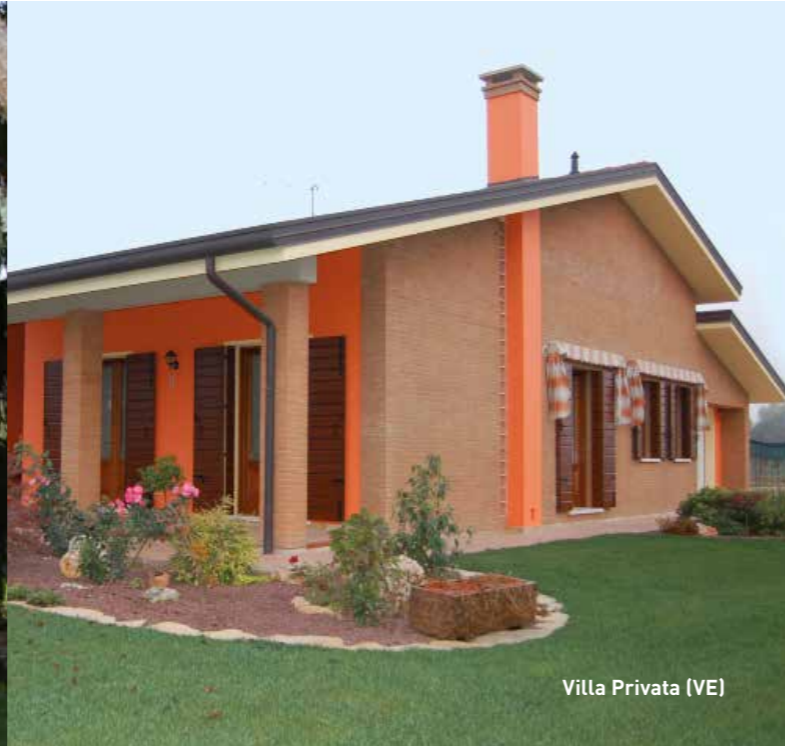
Villa Privata (VE)