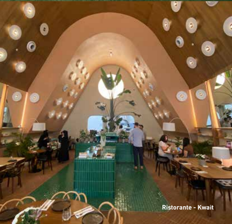
Ristorante - Kuwait