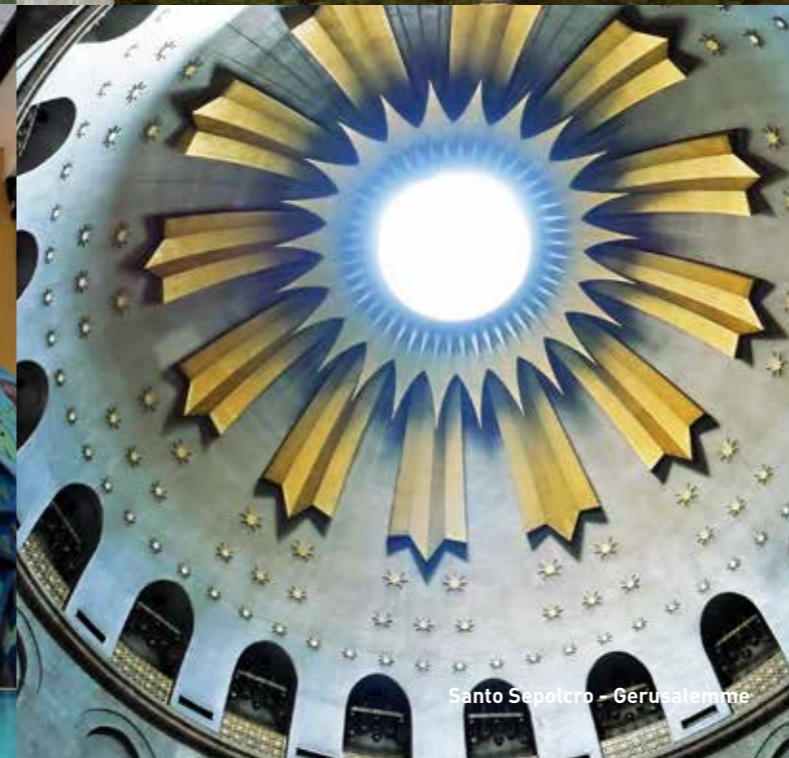
Santo Sepolcro - Gerusalemme