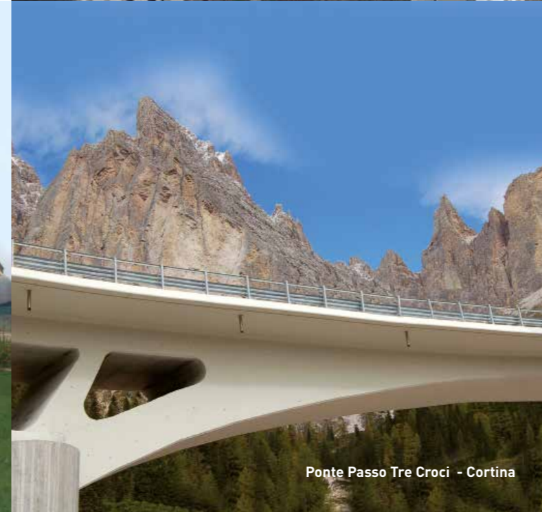
Ponte Passo Tre Croci - Cortina