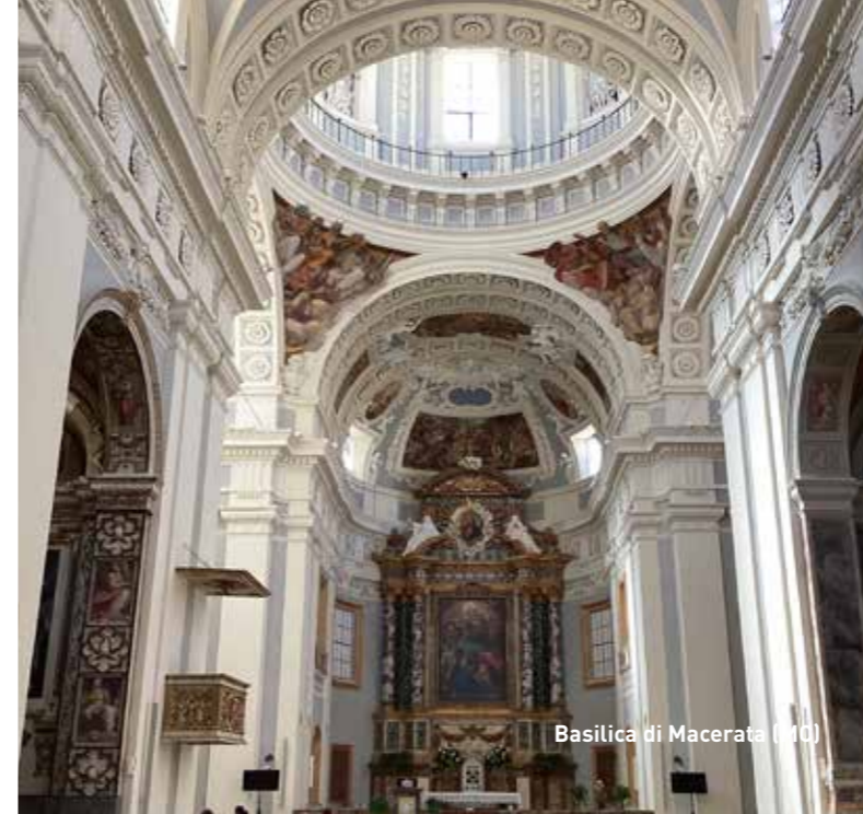
Basilica di Macerata (MC)

I prodotti Ard vengono applicati da oltre ottant'anni in Italia e all'estero in tutti i campi dell'edilizia. Abbiamo fornito i materiali per realizzazioni e ristrutturazioni di importanti lavori del settore edile residenziale, pubblico e terziario, nonché di numerosi edifici storici. La nostra gamma merceologica è in grado di fornire cicli e soluzioni per le patologie sui principali supporti quali intonaco, cemento, mattoni, materiale lapideo, legno, metalli e materie plastiche, garantendo le massime performance sia in ambienti interni che negli esterni.