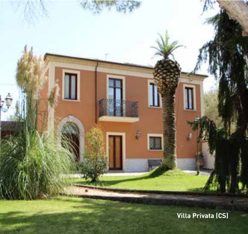
Villa Privata (CS)