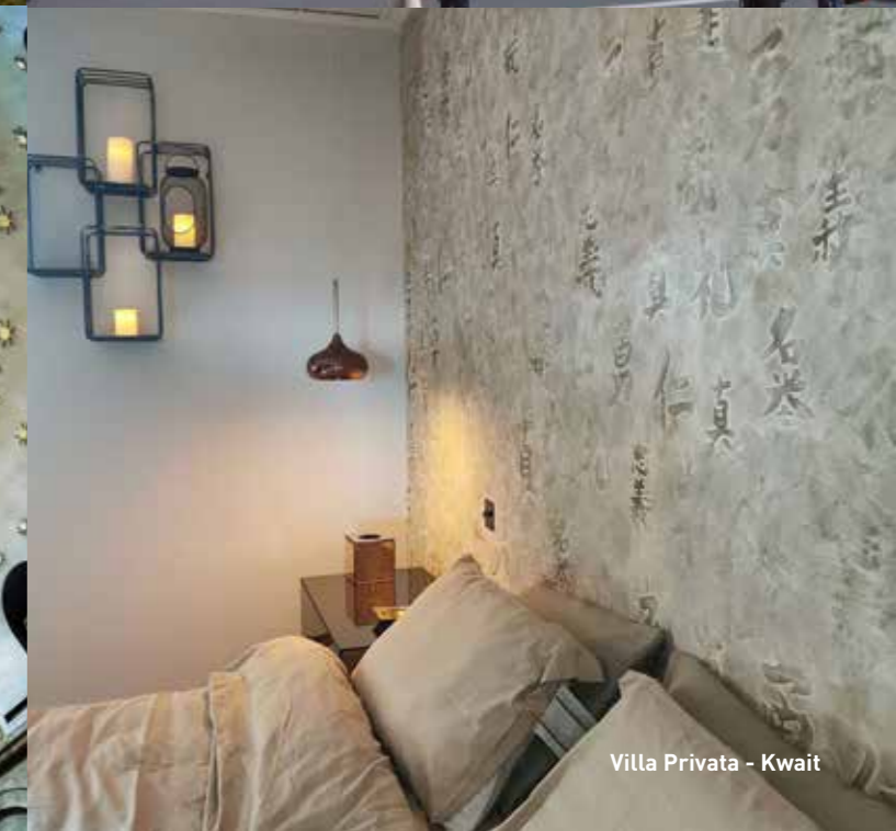
Villa Privata - Kuwait